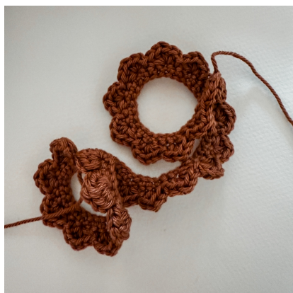
La chaînette de picots terminées...