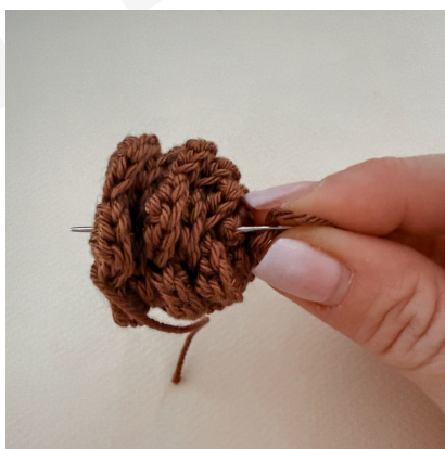
Avec le fil en attente de la fin, faites plusieurs allers-retours en « transperçant de part et d'autre la pomme de pin pour fixer les étages entre eux.