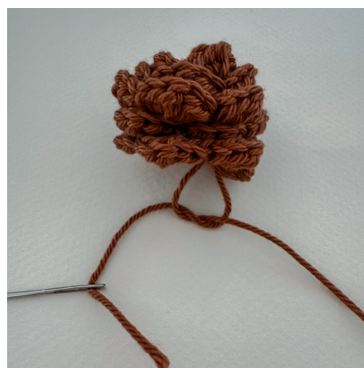
Nouez les fils du début et de la fin. Cousez la pomme de pin à l'endroit souhaitée ou collez-la à la colle chaude.