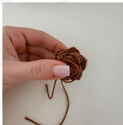
Vous obtenez une petite boule.